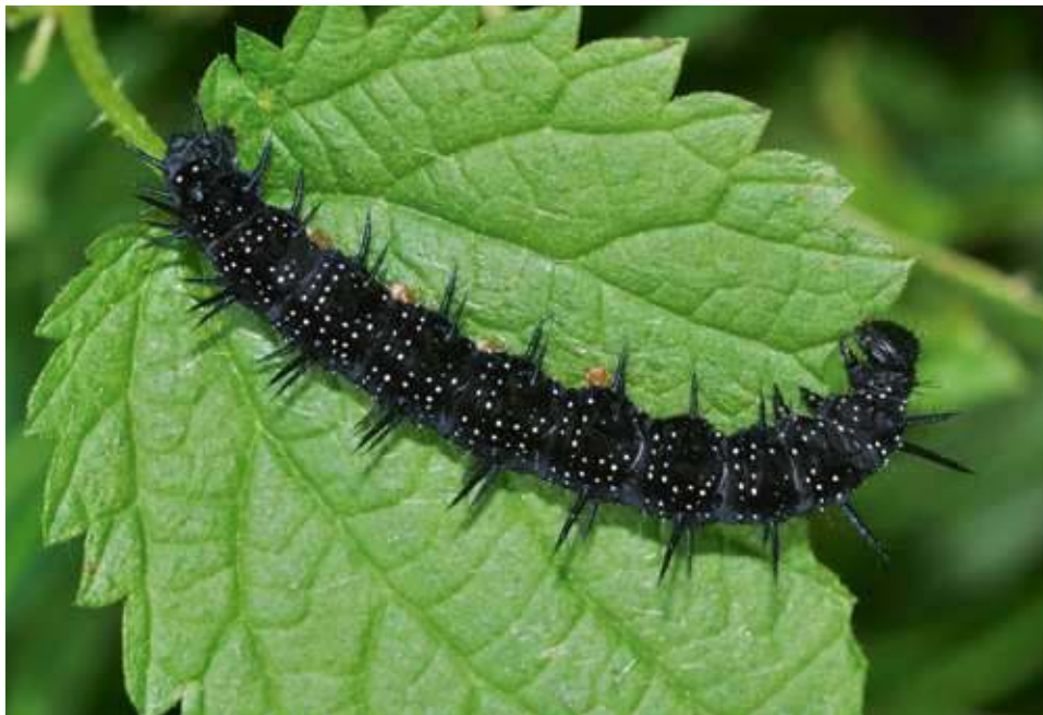
De grote brandnetel ( Urtica dioica ) is een indicator voor een stikstofrijke bodem.